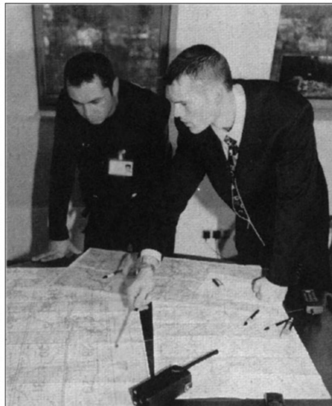
Präzise Einsatzplanung gewährleistet höchste Qualität

heitsaufgaben auf Wunsch auch der Kartenverkauf und die Einlaßüberwachung übernommen wird.