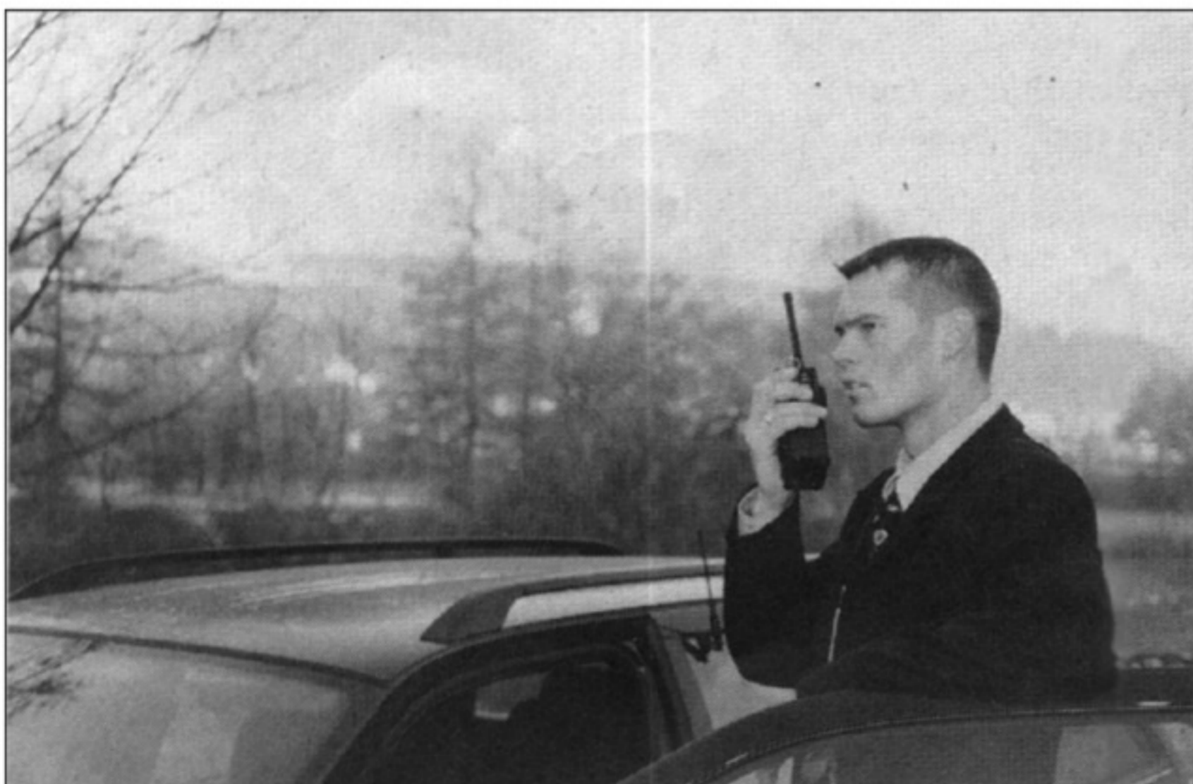
Koordination und Problemlösung vor Ort

Am Samstag, 20. Februar ist die Ausstellung wegen anderweitiger Belegung des Raumes geschlossen.